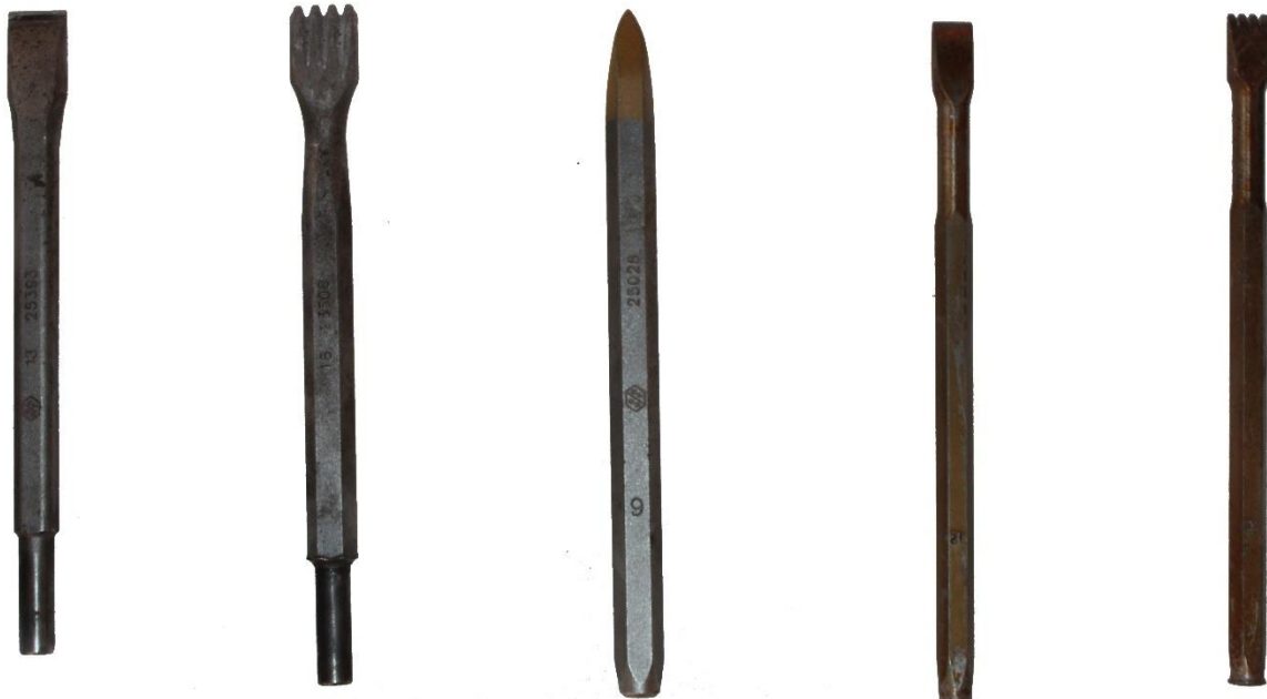
Εικόνα 1 Από αριστερά προς τα δεξιά: α) Γλωσσάκι διαμαντέ πιστολιού β) Ντισλίδικο διαμαντέ πιστολιού γ) Βελόνι διαμαντέ χειρός δ) Γλωσσάκι διαμαντέ χειρός ε) Ντισλίδικο διαμαντέ χειρός