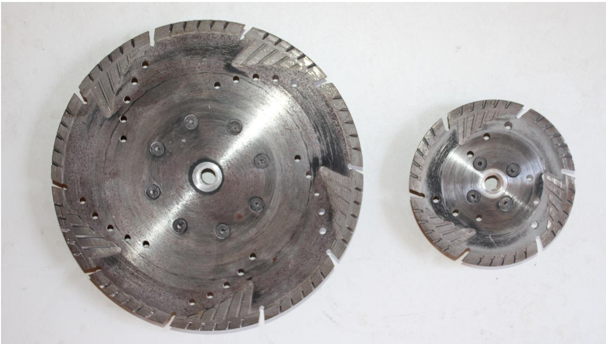
Εικόνα 2 Δίσκοι κοπής γρανίτου-πέτρας με φλάντζα