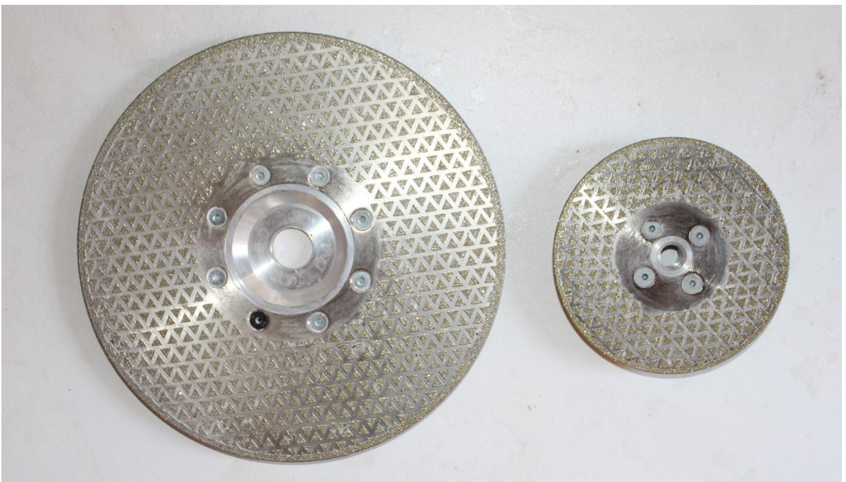
Εικόνα 3 Δίσκοι κοπής – λείανσης ηλεκτρολιζέ με φλάντζα